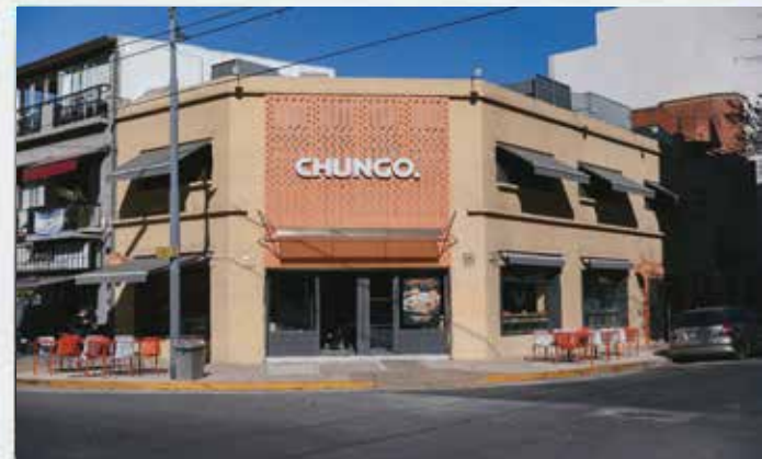
Formato: Full Tradicional