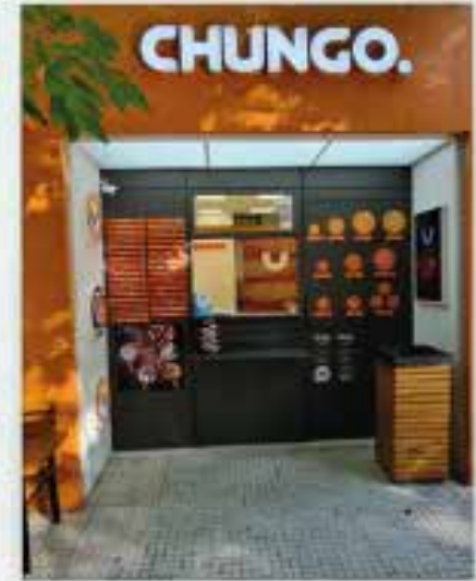
Formato: Delivery y Take Away