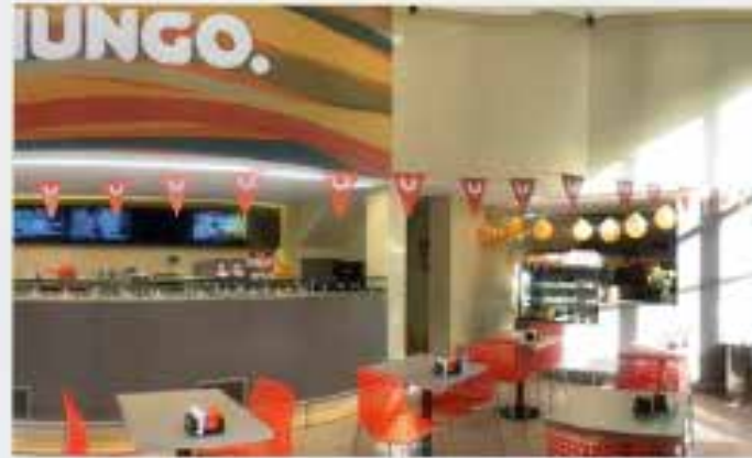
Formato: Full Tradicional