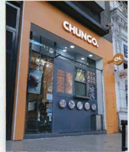
Formato: Delivery y Take Away