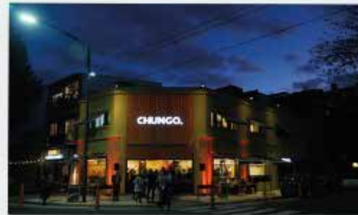
Formato: Full Tradicional