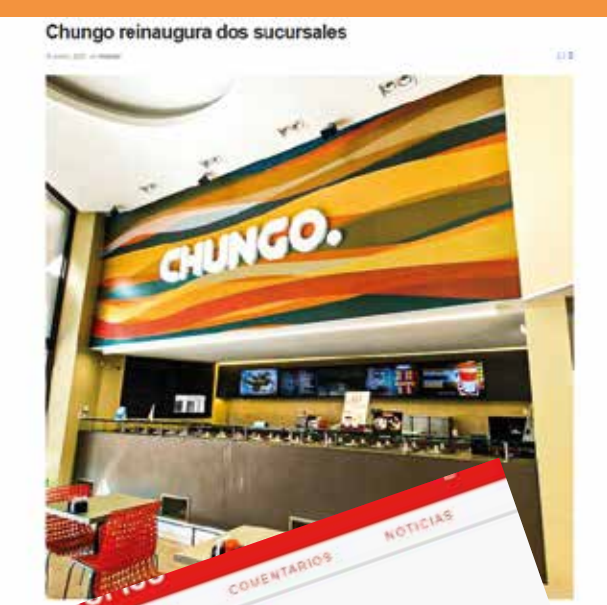
Chungo reinaugura dos sucursales

Se asoció con Amoedo, para armar un menú completo. Otros dos casos de asociatividad impulsados por la ONG Inicia.