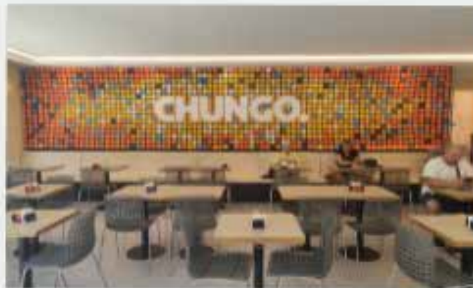
Formato: Full Tradicional